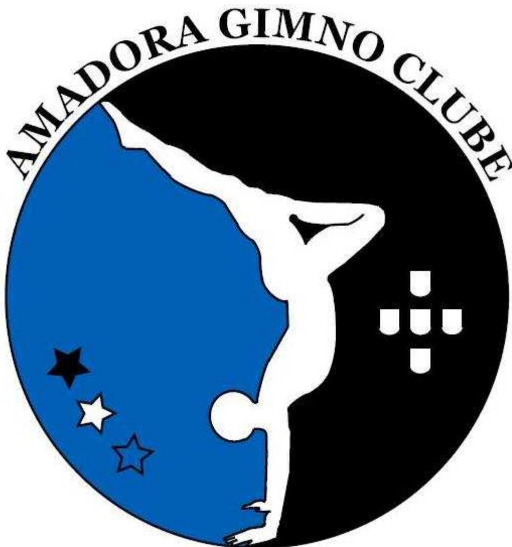
Símbolo do AGC