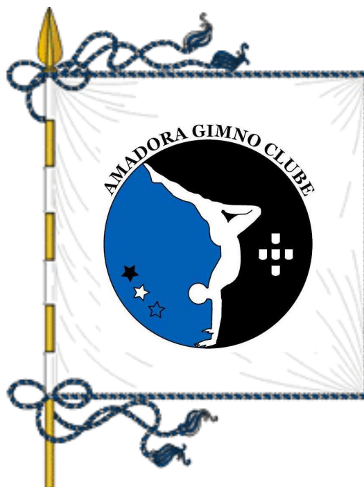
b) Estandarte do AGC